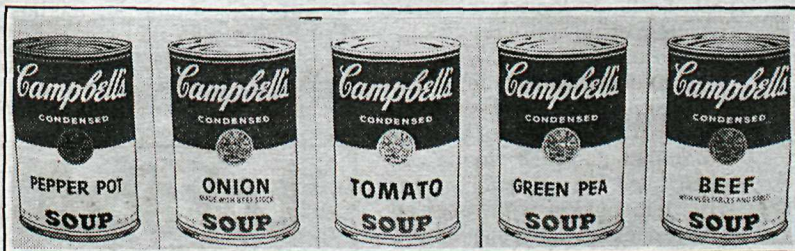
Andy Warhol sýndi fram á að dósasúpur eru ekki bara til að borða þær.