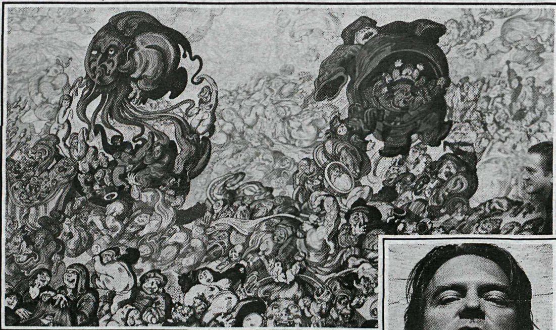
Erró og verkið, sem í framtíðinni mun prýða Borgarleikhúsið nýja.

Erró býr nú til skiptis í Thailandi, í París og á Mallorca. Hann mun lengi hafa haft í huga að gefa Reykjavíkurborg listaverkin, en það hefur tekið sinn tíma að koma safninu saman. Engin skil-