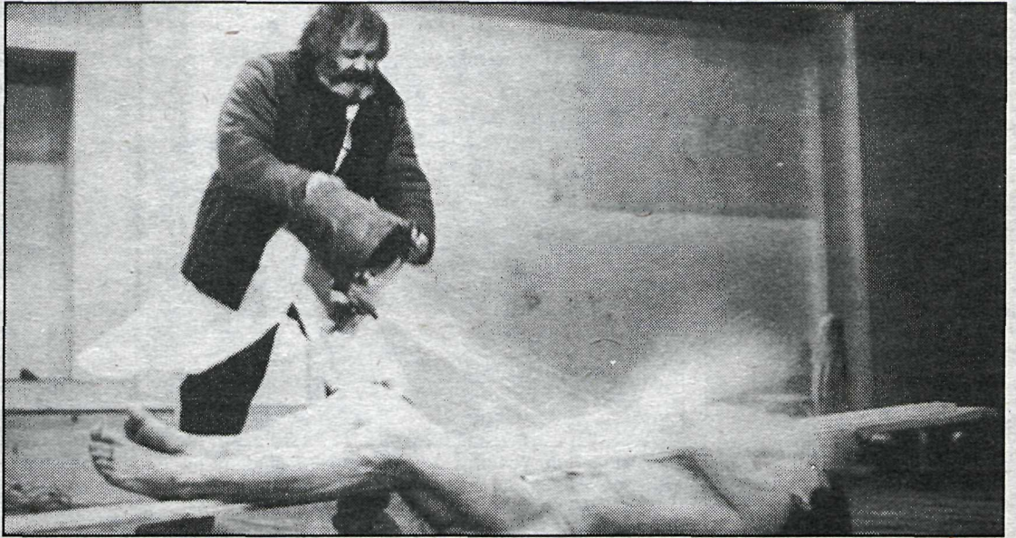
Sýning Lilla Teatern á Nikítas gæslumanni hefur alls staðar fengið mikið lof.

Sýningar Lilla Teatern um helgina eru í Íslensku óperunni á sunnudag og mánudag kl. 20.30.