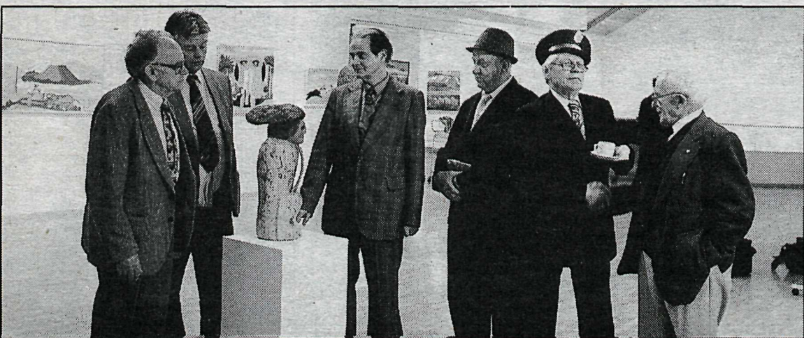
Nokkrir listamenn, sem eiga verk á sýningunni í Hafnarborg, samankomnir í sýningarsalnum.

Á veggspjaldi sýningarinnar er kort af hverfinu sem auðveldar gestum að rata frá einu verki til annars. Sérstök dagskráratriði eru kynnt í auglýsingum frá framkvæmdastjórn Listahátíðar í Reykjavík.