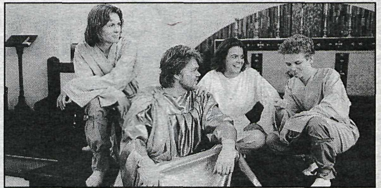
Mynd þessi er tekin á æfingu á Abraham og Ísak.

Listahátíðin í Garðabæ á að minna á tvennt. Í fyrsta lagi á þennan glæsilega hóp ungs fólks á framabratum sem er í stöðugri leit að hinum eina sanna tóni og í öðru lagi á listahátíðin að minna á þörfina á því að byggð verði sem fyrst menningar- og listamiðstöð í Garðabæ. Sala aðgöngumiða er hafin og fást þeir í bókabúðinni Grímu við Garðatorg í Garðabæ og er verð miðans 1000 kr. Aðgöngumiðar verða seldir við innganginn í Íslensku óperunni og í Kirkjuhvoli.