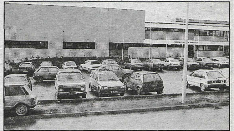
Fjölbrautaskólinn í Breiðholti.

Almenningi er auk þess boðið á tónlistarkvöld sunnudag, mánudag, þriðjudag og miðvikudag og myndlistarsýningin verður opin frá klukkan 14.00 til 18.00 sunnudag og þriðjudag en 14.00 til 20.00 mánudag og miðvikudag. Á sunnudagskvöld verður djasskvöld í Hátíðar-