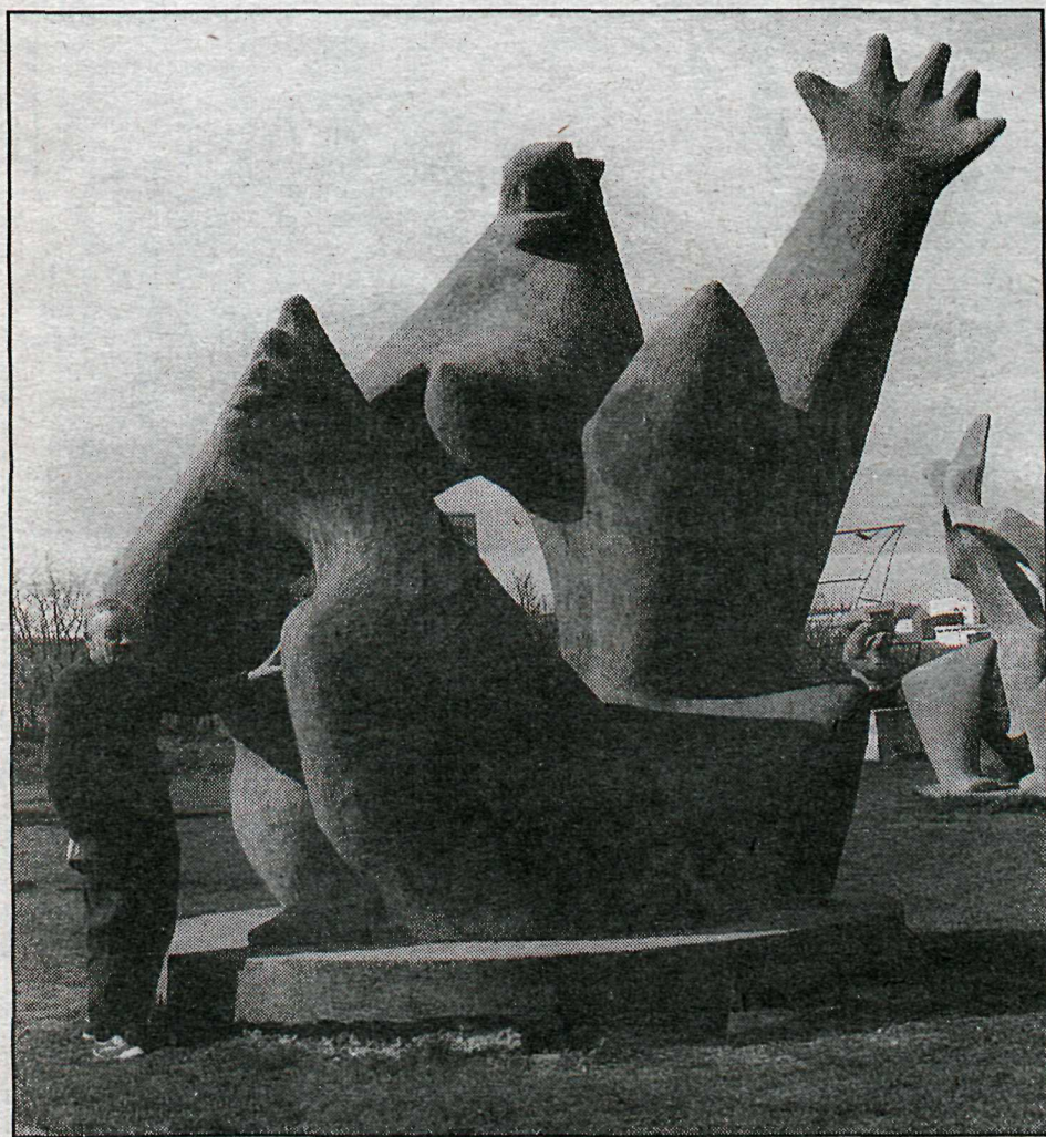
Ásmundur Sveinsson: Tröll, 1948. Höfundur verksins stendur við hliðina á því.

til náms í Danmörku. Hann hlaut klassíska menntun, sem hann kunni að nýta sér og umbreyta alla sína tíð. Hann var opinn og einlægur gagnvart ólíkum myndmálum; einfaldar hefðbundin gildi í sína frumdrætti; snýr út úr evrópski myndlistarhefð í primitífum verkum sínum og neitar sér ekki um að vitna til kúbismans. Þó svo að hann hafi ekki í raun tileinkað sér óhlutlæga myndgerði fyrr en á 6. áratugnum