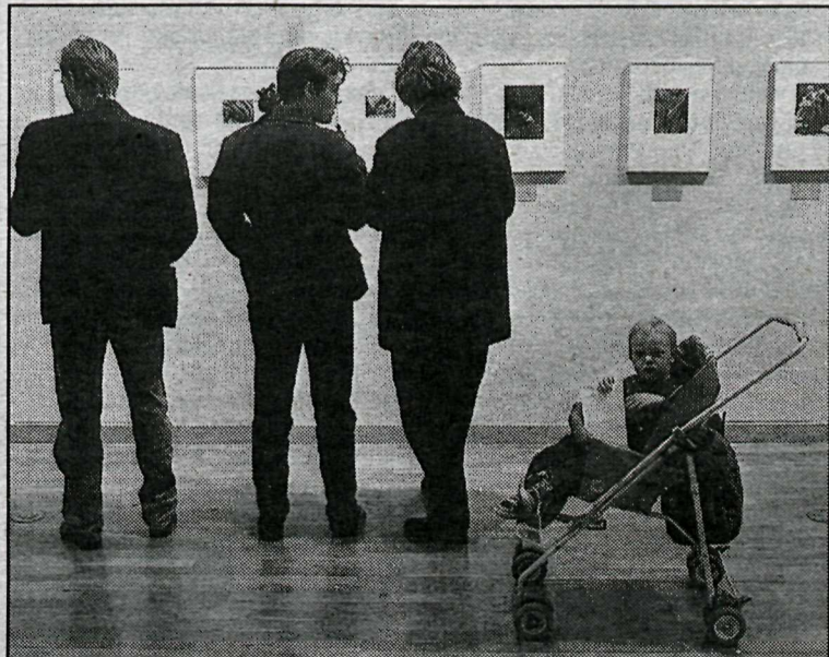
Sá stutti hafði meiri áhuga á ljósmyndaranum en ljósmyndunum.