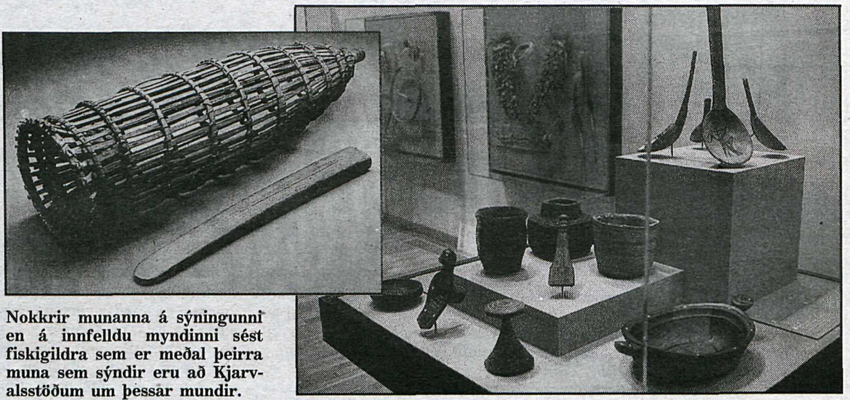
Nokkrir munanna á sýningunni en á innfelddu myndinni sést fiskigildra sem er meðal þeirra muna sem sýndir eru að Kjarvalsstöðum um þessar mundir.

Það er ekkert sem bendir til þess nú, að í bráð verði Sovétríkin traustur samningsaðili, þvert á móti kynni að vera skynsamlegast að taka upp viðræður beint við fulltrúa einstakra sovéskra lýðvelda, svo sem Rússlands, og kanna hug þeirra. Við Eyrstrasaltíð allt var áður góður markaður fyrir saltsíld. Þar eru nú uppi áform um að hefja svæðisbundna samvinnu og hefur Björn Engholm, forsætisráðherra þýska sambandslandsins Slesvíkur-Holtsetalands, gerst sérstakur talsmaður hennar. Höfum við Íslendingar sýnt slíkum hugmyndum nægan áhuga? Er sjónarhorn okkar ekki of þröngt, ef við einblinum á saltsíldarviðskipti við fulltrúa sovésku ríkisstjórnarinnar í Moskvu?