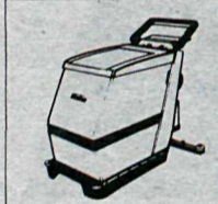
Gólfþvottavélar drifnar með rafgeymum.