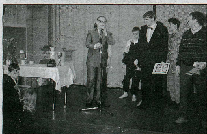
Svarar Gestis afhendir verðlaunin á Íslandsmeistaramóti í Svarta-Péttri 1991.