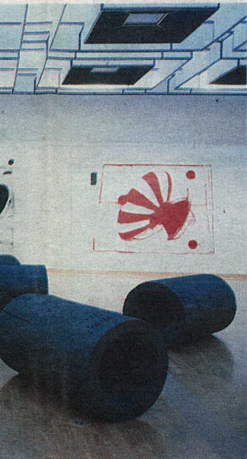
og eldur, 1989. Bakvið má sjá myndir eftir