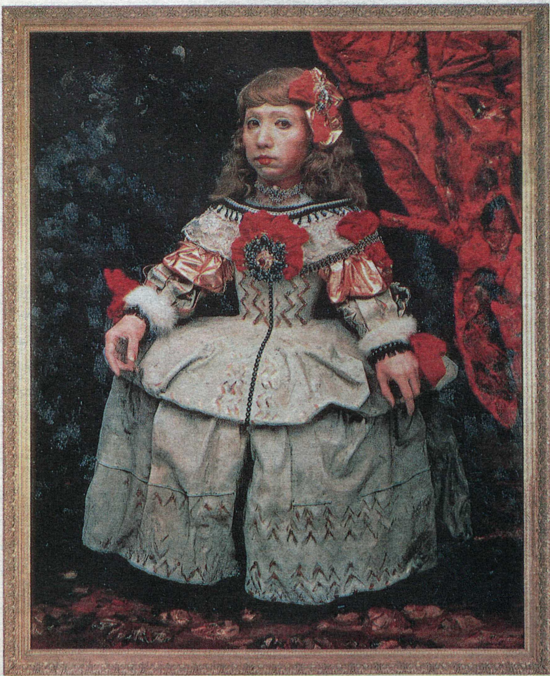
Yasumasa Morimura: Dóttir listasögunnar: A prinsessa ; blönduð tækni, 1990.