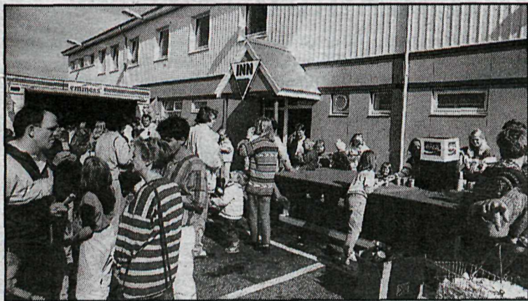
Fjöldmenn þáði veitingar í tilefni dagsins.

Húsasmiðjan opnaði fyrir skömmu nýja glæsilega verslun að Helluhrauni í Hafnarfirði. Mikið var um dýrðir í tilefni dagsins og fjölmenni var á staðnum. Meðal þess sem efnt var til í tilefni dagsins var happdrætti þar sem dregið var um vinninga að andvirði hundruð þúsunda króna, en happdrættis var þannig framkvæmt, að dreyfibréf var borið í öll hús í Hafnarfirði, á Álftanesi og í Garðabæ, en þeir sem vildu vera með þurftu að koma bréfinu útfylltu í kassa sem komið var fyrir við opnun verslunarinnar. Alls bárust nöfn 5350 þátttakenda.