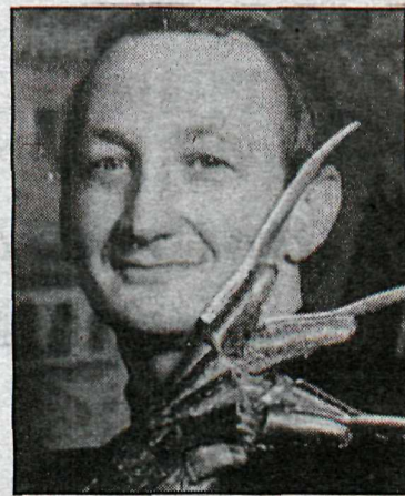
Robert Englund, öðru nafni Freddy Kruger.

verðar. Þær hafa staðið undir sex kvikmyndum hvorki meira né minna. En nú er mál að linni. Það þykir við hæfi að kvikmyndin sé sýnd í dag, því nú er ekki bara föstudagur, heldur 13. mánaðar að auki, en önnur svona maraþonmórðasaga sem gengið hefur hart nær jafn lengi og Almstrætismorðin er einmitt kennd við „Föstudaginn 13.“. Robert Englund hefur alla tíð leikið Fredda, fyrst árið 1984 og nánast árlega síðan. Hann segir framleiðendurna ákveðna í að hætta og vitnar í nafn myndarinnar, „Freddys Dead - The Final Nightmare“, eða „Freddy er dauður - Síðasta martröðin“. „Ég geri ráð fyrir að þeir passi sig að halda smugu opinni ef það dytti í þá að taka aftur upp þráðinn, en hvað