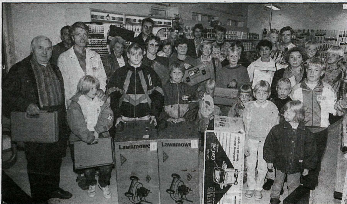
Vinningshafar í happdrættinu ásamt nokkrum aðstandendum.