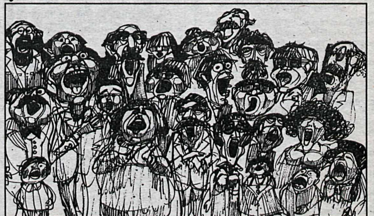
Kórahátíð MS-félags Íslands verður haldin á morgun, laugardag, í Háskólabíói klukkan 15 og er til styrktar húsbyggingarsjóði MS-félagsins.