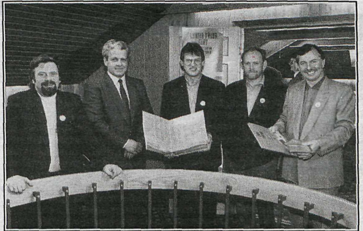
Ríó hefur gefið út plötuna Landið fýkur burt og fær Landgræðslan allan ágóða af sölu hennar.

Kaupþing hf hefur tekið að sér að fjármagna verkefnið og veita ráðgjöf. Forseti Íslands, Vigdís Finnbogadóttir, styður framtakið einnig og ritar hvatningarorð á plötuumslagið sem er hannað af auglýsingastofunni Nýr dagur. -vð.