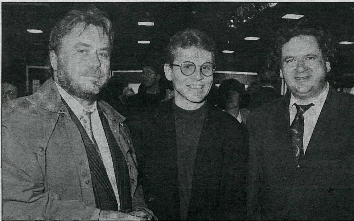
„Útvarp Matthildur“ er það fyrsta sem mörgum dettur í hug þegar þeir sjá þessa þrjá heiðursmenn saman. Það er ekki nema von því það voru einmitt Hrafn Gunnlaugsson kvikmyndagerðarmaður, Þórarinn Eldjárn rithöfundur og Davíð Oddsson forsætisráðherra sem stjórnðu á árum áður geysivinsælum þætti undir þessu nafni. Nú um helgina hittust þeir á Kjarvalsstöðum við opnun ljóðasýningar Þórarins.