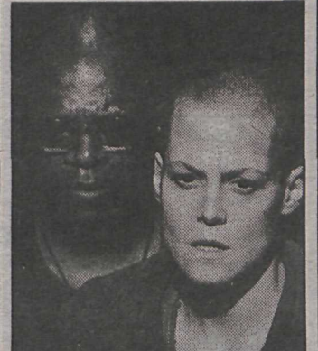
Sigourney Weaver og Charles S. Dutton.