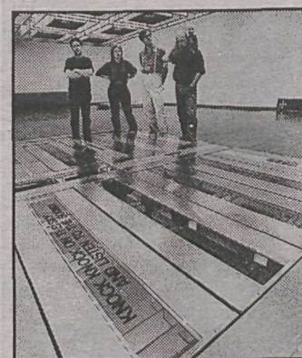
Listafólkið við uppsetningu sýningarinnar.

15 ára stúlka er sögð hafa geispað viðstöðulaust í 5 vikur árið 1888.