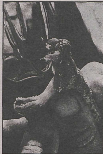
Haldið fyrir eyrun á snáki!