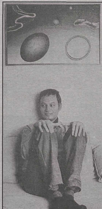
Sýningin Orðlist Guðbergs Bergssonar í tilefni 60 ára afmælis skáldsins verður opnuð á laugardag.