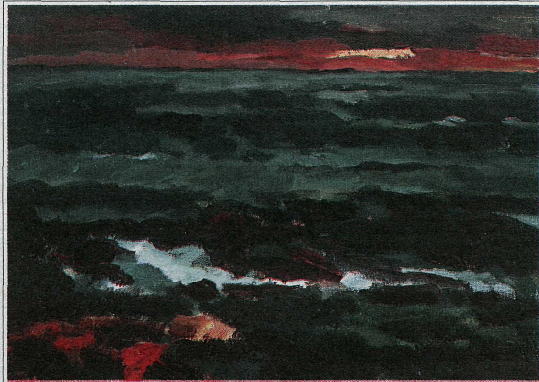
„Við sjóinn“. Ólía á striga. 1982.

unni, sem einnig var af hinu góða, því að eðlismunurinn er hér mik-ill svo að hver og einn hefur gott af aðhaldi og því að upplifa hann í vinnu sinni.