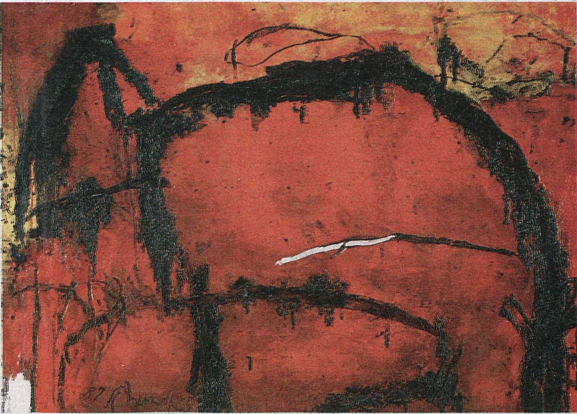
Emil Schumacher: „Temus“ 1987.