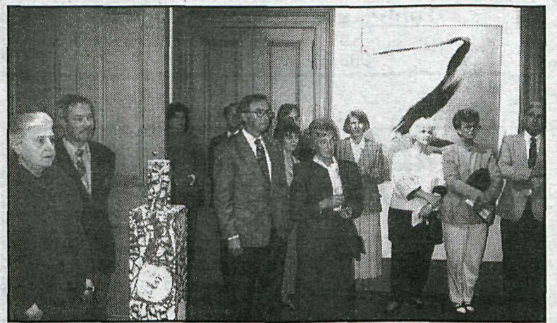
Nokkrir gestanna á opnuninni í Maclaurin Art Gallery.