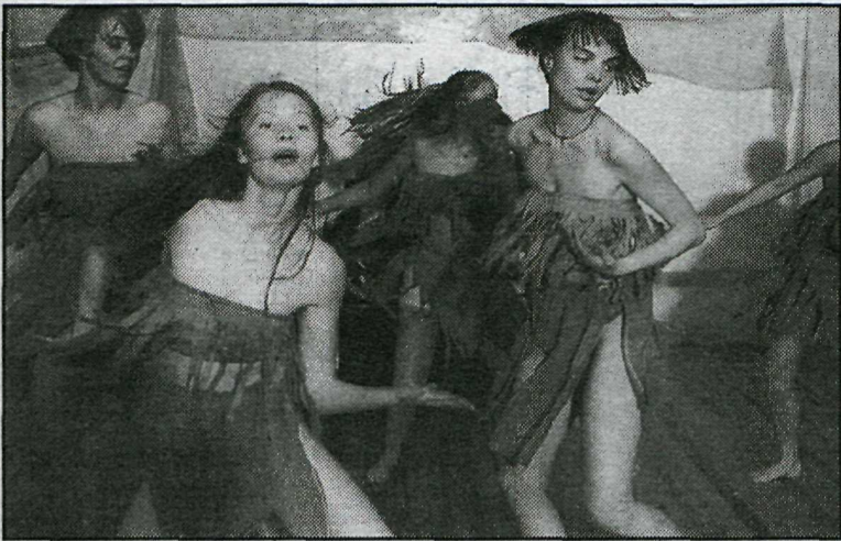
Dansarar hjá Kramhúsinu sýna afró-brasilískar listir í dag og á morgun.