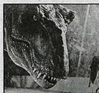
Grameðlan reynist fólkinu skeinuhætt.