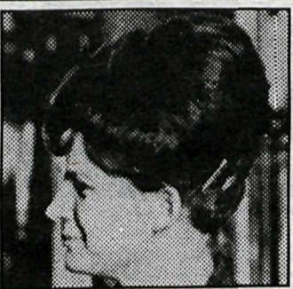
Valentina Térésjkova var fyrsta konan út í geiminn.