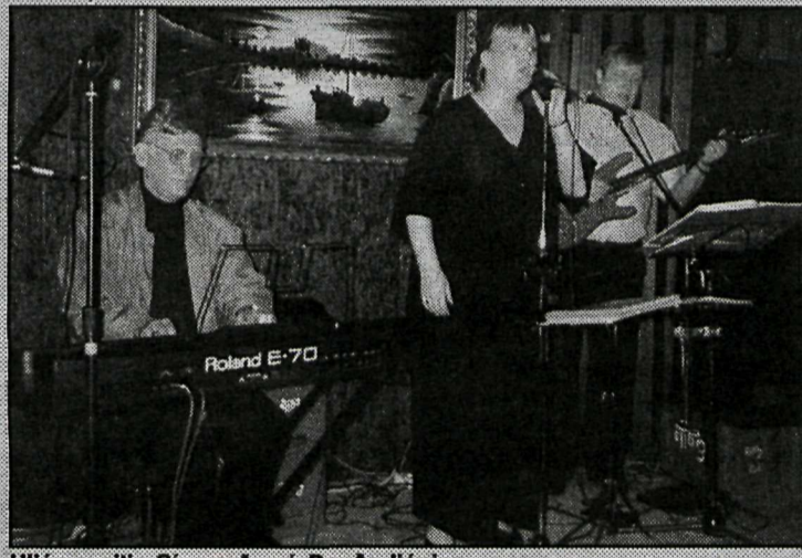
Hljómsveitin Sín verður á Rauða ljóninu.

Hljómsveitin leikur alls konar tónlist og yfirleitt það sem gestirnir biðja um en íslenskir slagarar og danstónlist er í hávegum höfð hjá Sín.