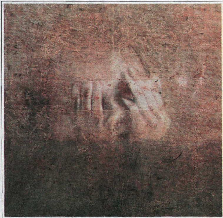
Fenevjaskólinn I: Boðunin 1993. Olía, sag, tré og lím á striga.

En þessi sérstaka áferð, sem er trúlega fylgífiskur hliðarstarfa listamannsins í leirlist, og ég hef stundum átt erfitt með að fella mig við í málverki, er ekki horfin með öllu. Hún birtist helst í myndunum af Sambandshúsinu svo og myndinni „Upprísá“, sem er af fæti Krists með naglasárinu fyrir