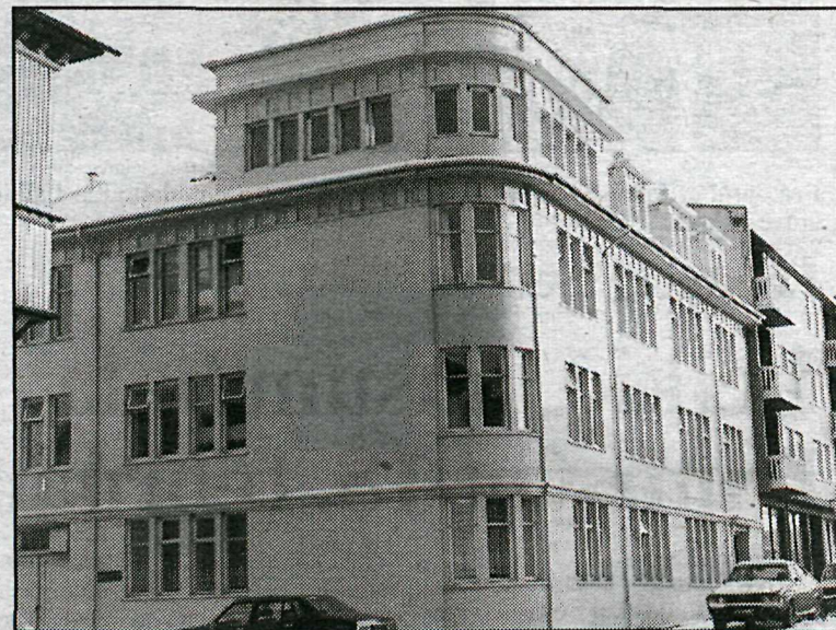
Hvítabandið við Skólavörðustíg.

dómtr, en aðrir sjúkdómar sem valda óafturkræfri breytingu á hugarstarfi eru sjaldgæfari og af ýmsum toga spunnir. Markmið hjúkrunar felast í því að tryggja öryggi og vellíðan sjúklunga og standa vörð um sjálfsmynd þeirra og sjálfsvirðingu. Helstu leiðir að þessum markmiðum eru m.a. að fylgjast með einkennum sjúkdómsins og heilsufari almennt og gera víðeigandi ráðstafanir þegar þörf krefur. Koma í veg fyrir álag með því að hafa heimilislíf í föstum skorðum, tryggja handleiðslu og vísbendingar í umhverfinu og leitast við að hafa umhverfi heimilislegt, aðgengilegt og hættulaust. Stuðlað er að vellíðan með því að tryggja að undirstöðuþarfir séu uppfylltar og leitast er við að standa vörð um sjálfsmynd einstaklingsins með því að stuðla að virkri þátttöku hans í eigin umönnun og tryggja valmöguleika hans í athöfnum daglegs lífs.