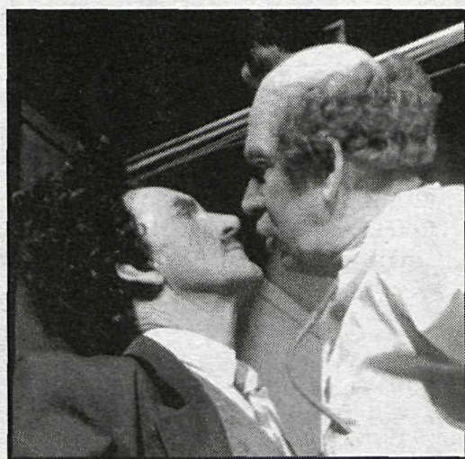
Læknisatriðið, eitt frægasta atriði Alla og Villa. „Það var klassískt. Þegar okkur tókst illa upp var það frábært.“