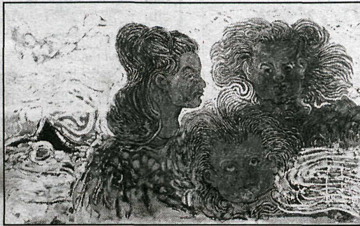
Systurnar á Stapa.

ferðamenn hans sem enn eru á lífi til að lýsa kynnum sínum af meistaranum.