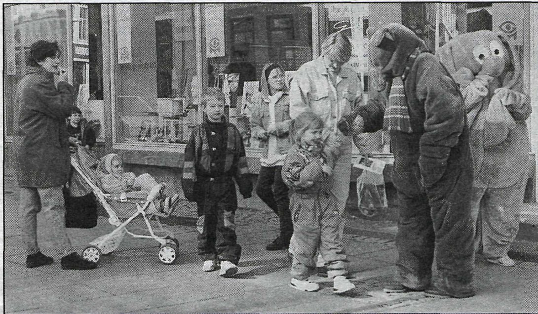
Unga kynslóðin var síður en svo skilin útundan á svokölluðum löngum laugardegi sem verslunarmenn á Laugaveginum stóðu fyrir um helgina. Hinn frægi Kódak bangsi og félagi hans röltu um Laugavegin í blönnu þar sem þeir vöktu að vonum mikla athygli hjá ungum vegfarendum.