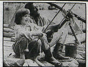
Elijah Wood og Courtney B. Vance í hlutverkum sínum í Stíkilsberja-Finni.