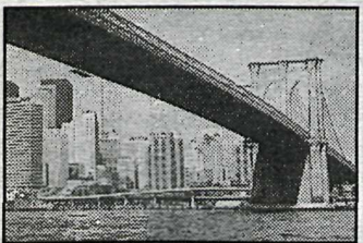
Margar brýr eru völdundarsmiði.

kvöld og annað kvöld skemmtir Loðin rotta sem hefur starfað með hléum undanfarin sex ár. Þarna fer reynslumikil hljómsveit sem hefur gert það gott í gegnum árin. Meðal hljómsveita sem koma fram á Gauknum í ágúst má nefna 1000 andlit, N1+, Galileo, Spoon, Black Out, Hunang, Vini Dóra og Vini vors og blóma.