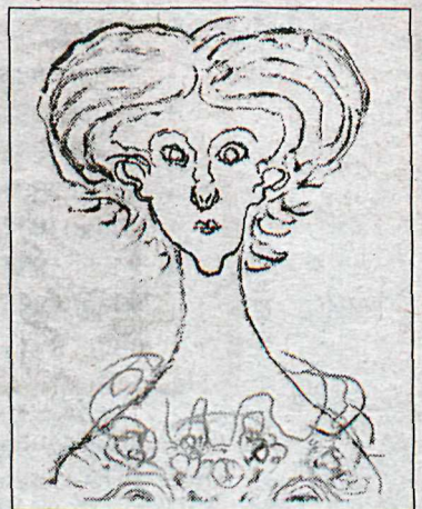
Jóhannes S. Kjarval: Kona.

Forráðamenn Kjarvalsstaða hafa gegnum tíðina fengið óskir um að ganga meðina verkum Jóhannesar S. Kjarvals vísum í húsinu. Og nú hefur menningarmálanefnd ákveðið að taka einn sal undir næst. Þannig verða verk Kjarvals sýnd þar vikur og einnig á sumarsýningu safnsins. Það á mikið af myndum eftir listamanninn og uppistaðan er gjöf hans til Reykjavíkurborgar frá 1968 á 5.000 verkum, mest skissum og teikningum. Síðan hafa fjölmargir