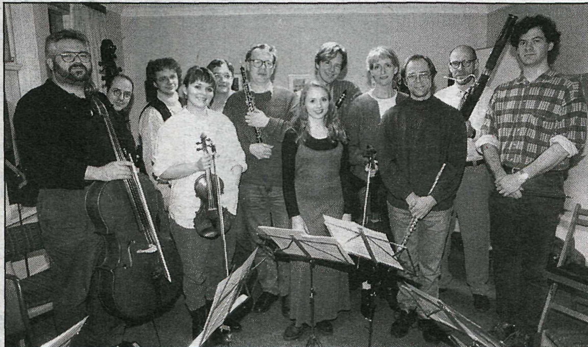
FLYTJENDUR á nýársónleikunum í Listasafni Íslands á sunnudaginn.

LISTASAFN Íslands heldur nýársónleika sunnudaginn 8. janúar kl. 20.30 í safninu að viðstöddum forseta Íslands, frú Vigdís Finnbogadóttur. Þetta eru aðrir nýársónleikar Listasafnsins.