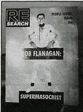
Unnendur masókisma geta notið sýningar Bobs Flannagan á Mokka.

Sýningin sem nú hengir á Mokka er svo ólík þeim skreytingum sem kaffihúsagestir eiga að venjast að aðstandendum hennar hefur ekki þótt óhætt annað en að ganga þannig frá að aðeins þeir sem eftir því sækjast fái lítið myndirnar. Fyrir hverri mynd hangir svart tjald sem áhorfandinn þarf að draga til hliðar til að skoða ljósmyndina sem bak við það er falin en þeir sem hætta sér bak við tjöldin fá að sjá myndir sem er ólíkt meira krassandi en það sem alla jafna er hylt sem eróttík í myndlist. Bob er masókisti og fer ekki fint með það. Í stað þess að fara í felur með kenndir sínar eða veita þeim aðeins útrás í lokuðum hópi vina hefur hann steypt þeim í ist og birtir nú myndir af sér í ástarleik út um alla veröld. Þetta hefur honum tekist svo vel að tímaritið Re-search hefur gefið út sérrit um hann, en það tímarit gefur toninn fyrir margt það sem mest er „in“ vestanhafs um þessar myndir (þetta er tímaritið sem hratt af stað b-myndaæðinu, gerði „götun“ og húðristur að tiskufyrirbæri og iðnaðartónlist að söluvöru).