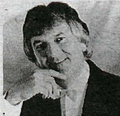
Owain Arwel Hughes