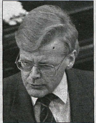
Ólafur Ragnar: Sérkennilegar yfirlýsingar.

fulla virðingu fyrir henni sem mótframbjóðanda. En út af fyrir sig hafa þessar sérkennilegu athugasemdir formanns flokksins vissulega vakið athygli mína.“