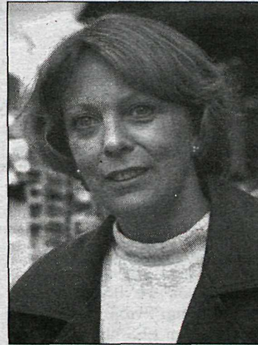
Margrét: Ég er raunar yngri en hún.