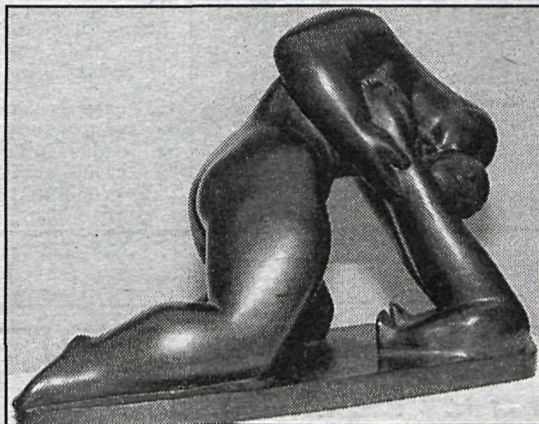
Eitt verka Ásmundar.