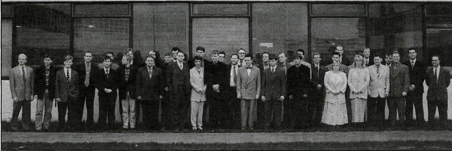
Nýútskrifaðir nemendur Tækniskólans voru 1995.