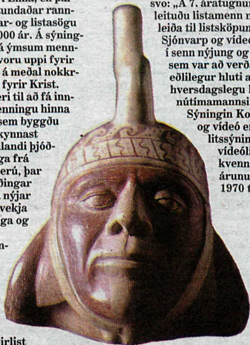
Forn leirlist frá Perú

Í Vestursal verður sýningin Leirlist frá Perú. Um er að ræða sýningu á úrvali leirlistaverka frá Þjóðminjasafninu í Líma, en þar hafa lengi verið stundaðar rannsóknir á menningar- og listasögu Perú síðastliðin 6000 ár. Á sýningunni eru munir frá ýmsum menningarhópum sem voru uppi fyrir tíma inkanna, þar á meðal nokkrir munir frá 5. öld fyrir Krist. „Hér gefst tækifæri til að fá inn-sýn í háþróaða menningu hinna ýmsu þjóðabrota sem byggðu Perú til forna og kynnast dularfullri og heillandi þjóðmenningu, aðallega frá strandhéruðum Perú, þar sem fornleifafraeðingar eru sífellt að gera nýjar uppgötvanir sem vekja furðu sagnfræðinga og annarra sérfræðinga,“ segir í kynningu.