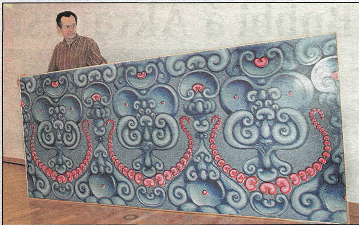
Á Kjarvalsstöðum eru nú sýnilegar vissar áherslubreytingar í myndlistarheiminum.

Á morgun verður opnuð í vestursal Kjarvalsstaða sýning á íslenskrí samtímalist sem ber yfirskriftina Eins konar hversdagsrómantik. 16 listamenn sýna. Þá verður opnuð í miðrymi og forsöl-