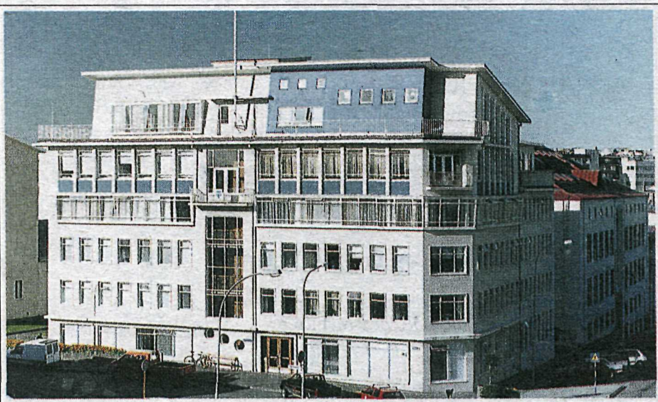
SKÚLATÚN 2 - aðsetur borgarstjórnar þar til ráðhúsið var byggt.