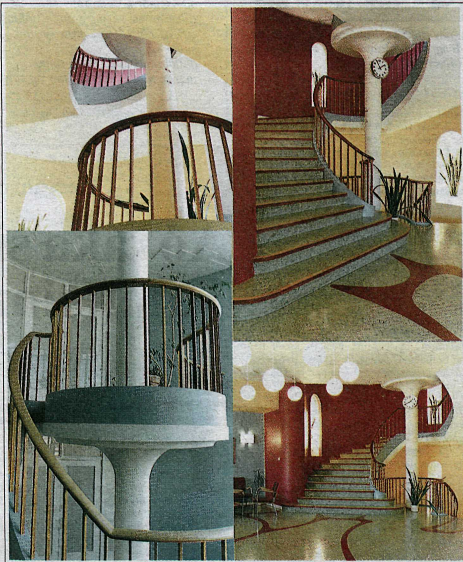
HEILUVERNDARSTÖÐIN við Barónsstíg að innanverðu. Þar eru ýmis fagurlega unnin smáatriði og Einar notar þar oft sveigðar línur, sem sízt af öllu voru í tísku þegar húsið var byggt.

Hugmyndafræði fúnksjónalismans var ákaflega heidarleg, ef svo má að orði komast. Mergurinn málsins var að „fúnksjónin“, það sem gert er í húsinu, ráði útliti þess. Ekki