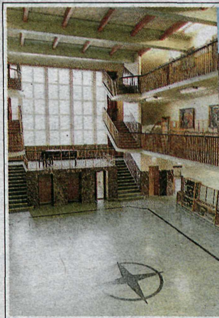
SALURINN í miðhluta Laugarnesskólans var nýstárleg lausn, en þar að auki listræn og glæsileg.

sól. Frá heilsufræðilegu sjónarmiði þurfa helst öll íbúðarherbergi að njóta sólar minnst 1-2 tíma á dag. Ákjósanlegast er, að sólarlími hvers herbergis falli saman við þann tíma, sem herbergið er aðallega notað, og því er eftirfarandi herbergjaskipun æskileg: Svefnherbergi og barnaherbergi hafi glugga móti austri eða suðri, borðstofan gegn suðri og einnig gegn austri, ef því verður við komið. Dagstofan hafi glugga gegn suðri og vestri, til þess að fá eftirmiðdags- og kvöldsólinu. Oft er t.d. með útbýggingu, einnig hægt að fá austurglugga á dag-