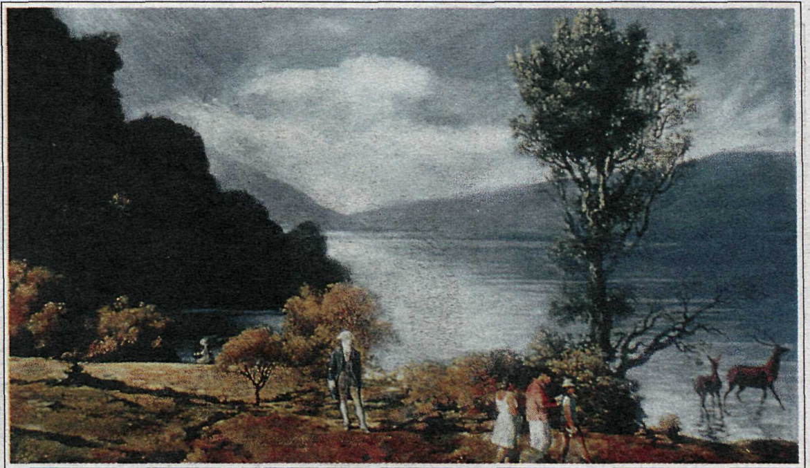
EFTIRSÓTTASTA málverk bandarísku þjóðarinnar (1994) eftir Komar og Melamid.