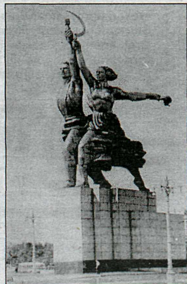
Komar og Melamid efndu til samkeppni 1993 um hvað gera skyldi við þau ókjör af minnisvörðum frá kommúnistatímanum sem til eru í fyrrum Sov-étríkjunum. Meðal annars barst þessi ágæta hugmynd Arts Spiegelmann um hvað gera skyldi við minnisvarðann „Bændur og verkamenn“ í Moskvu – halda honum óbreyttum en einfalda stallinn.

Byltingarsinnar hafa löngum talið fólkí trú um að fjarlægja verði öll óæskileg vegsummerki fortíðarinnar til að hægt sé að ryðja framtíðinni beina og bjarta braut. Þannig rústuðu kommúnist-ar höllum og kirkjum í kjölfar rússnesku byltingarinnar og lögðu Guð í einelti. Og nú vilja demókratar sópa yfir blóði-drifna slóð þeirra. Hingað og ekki lengra, sögðu Komar og Melamid. Að þeirra mati leiðir skemmdarstarfsemi í skjóli nýrra trúarbragða aldrei til góðs. Þeim er í mun að minnismarkjum kommúnismans verði bjargað. Ekki vegna fagurfræðilegra verðleika þeirra eða hugmyndafræðinnar sem býr að baki, heldur vegna þess að aðeins með