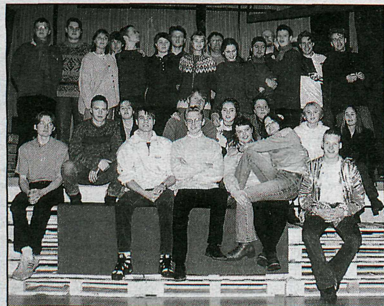
LEIKLISTARKLÚBBUR NFFA frumsýnir söngleikinn Grettir í sal Fjölbautaskóla Vesturlands á Akranesi á laugardag.