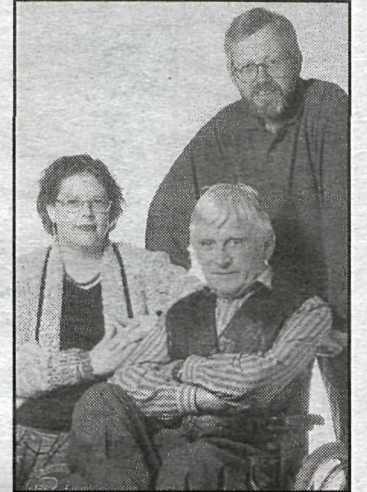
Kontrapunktslandslið Íslands áður en þau slitu samvistir...