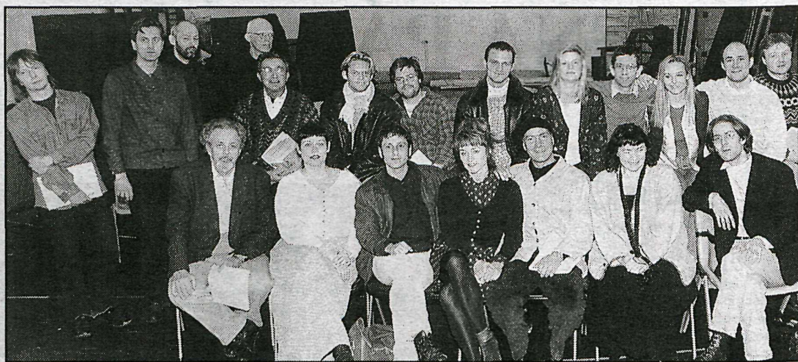
Í ÞJÓÐLEIKHÚSINU standa nú yfir æfingar á gamanleikriti Shakespeares, Sem yður þóknast, sem verður frumsýnt á Stóra sviðinu síðasta vetrardag.