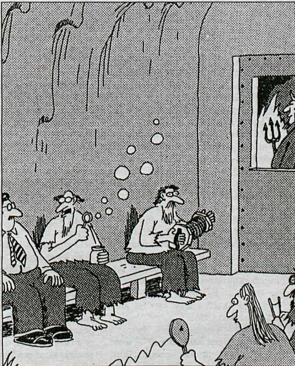
O, þeir finna fljótleiga eitthvað fyrir þig að gera... Ég? Ég á að blása sápuklúur til eilífðarnóns.