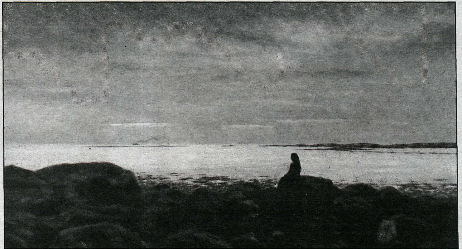
ÞÓRARINN B. Þorláksson: Sumarkvöld, 1904.