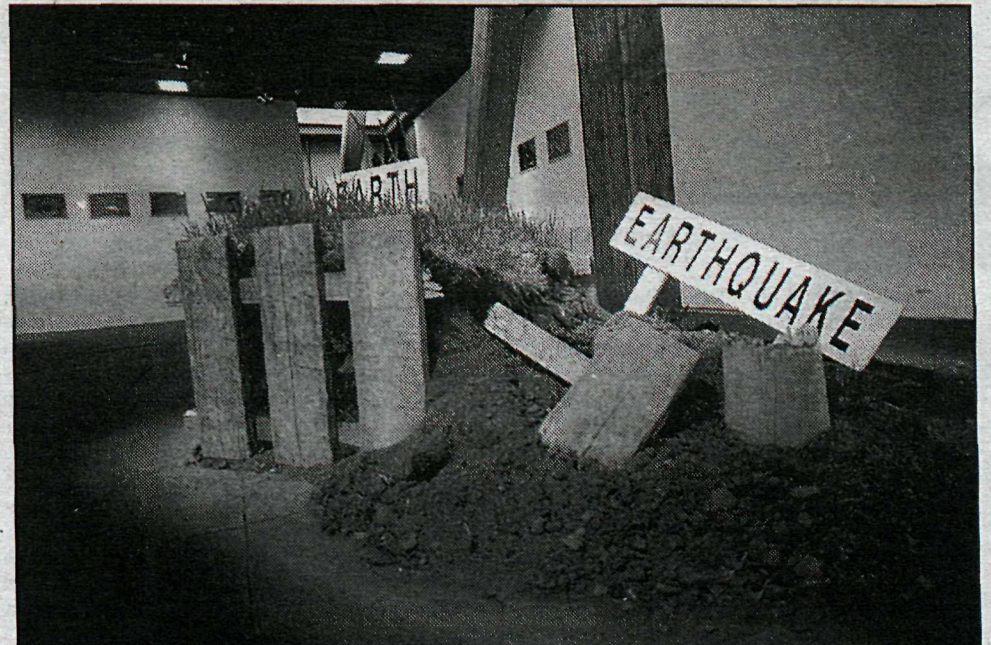
SIGURÐUR Guðmundsson: Earthquake.

Náttúrumyndmálið í nútímanum hefur óendanlegan fjölbreytileika, svo sem í ljós kemur á Kjarvalsstaðasýningunni. Þar má nefna smágerðar gróðurmyndir Eggerts