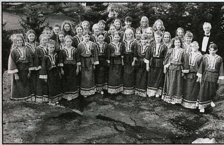
KÓR Öldutúnsskóla heldur aðventu- og minningartónleika í Víðistaðakirkju á þriðjudag.