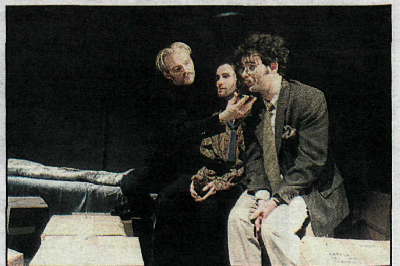
INGVAR E. Sigurðsson, Hilmir Snær Guðnason og Baltasar Kormákur í hlutverkum.

Listaverkið segir frá þremur karlmönnum sem hafa verið vinir árum saman en lenda í gráttroslegri tilvistarkreppu þegar einn þeirra fjárfestir í rándýru málverki.