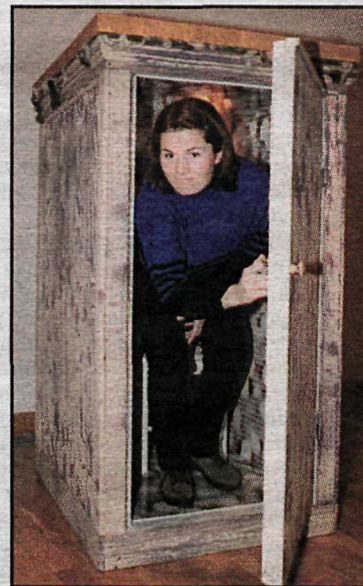
Nemendur FG fengu að setjast inn í litla skúra og leita að eigin organi. Þessi var ekki allveg viss um að hafa fundið það en reyndi þó.

„Listasögukennda á Íslandi er ekki mikil og sem ágætt dæmi um