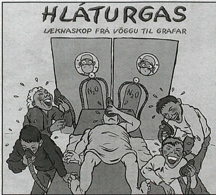
Hláturgas - Lækna-skop frá vöggum til grafar. 80 síða bók sem dreift verður ókeypis á 10 sjúkrahúsum um allt land.

Einnig hefur verið gefin út 80 síða bók með skopteikningum,