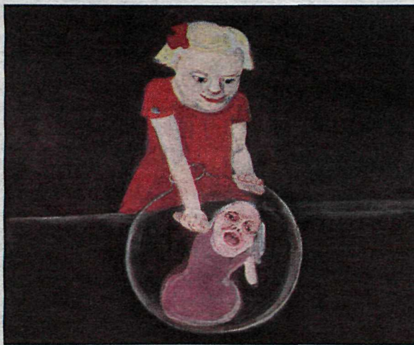
Lena Cronqvist: Stúlka í rauðu ásamt móður, 1999. Límlitir og olía á striga, 121 x 144 sm. Lena á tvímælalaut „Óþægilegustu“ verkin á sýningunni.