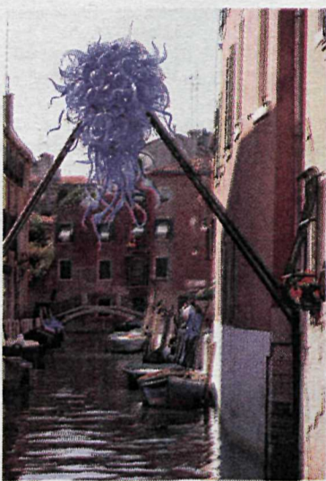
Innsetning í Fenejum. Chihuly hefur unnið mikið þar.

Verre, 1986). Samstarfsmenn hans lýsa honum sem stormsvæpi en hann kemur kannski eilítið undarlega fyrir sjónir, haltrandi með lepp fyrir öðru auganu. Leppinn fékk hann þegar hann missti sjón á öðru auga í bílslysi árið 1976 en hann hefur aldrei sett það fyrir sig frekar en þegar hann skaddaðist illilega á öxl á brimbretti tveimur árum síðar. Það slysi gerði það að verkum að hann getur ekki snúið og verkað glerið sjálfur (þar sem stangirnar eru niðþungar) og tók hann þá upp þá aðferð að nota teikningar og málverk til að tjá samstarfsmönnum sínum hugmyndir sínar. Síðan hafa myndirnar verið eitt af aðalsmerkjum hans.