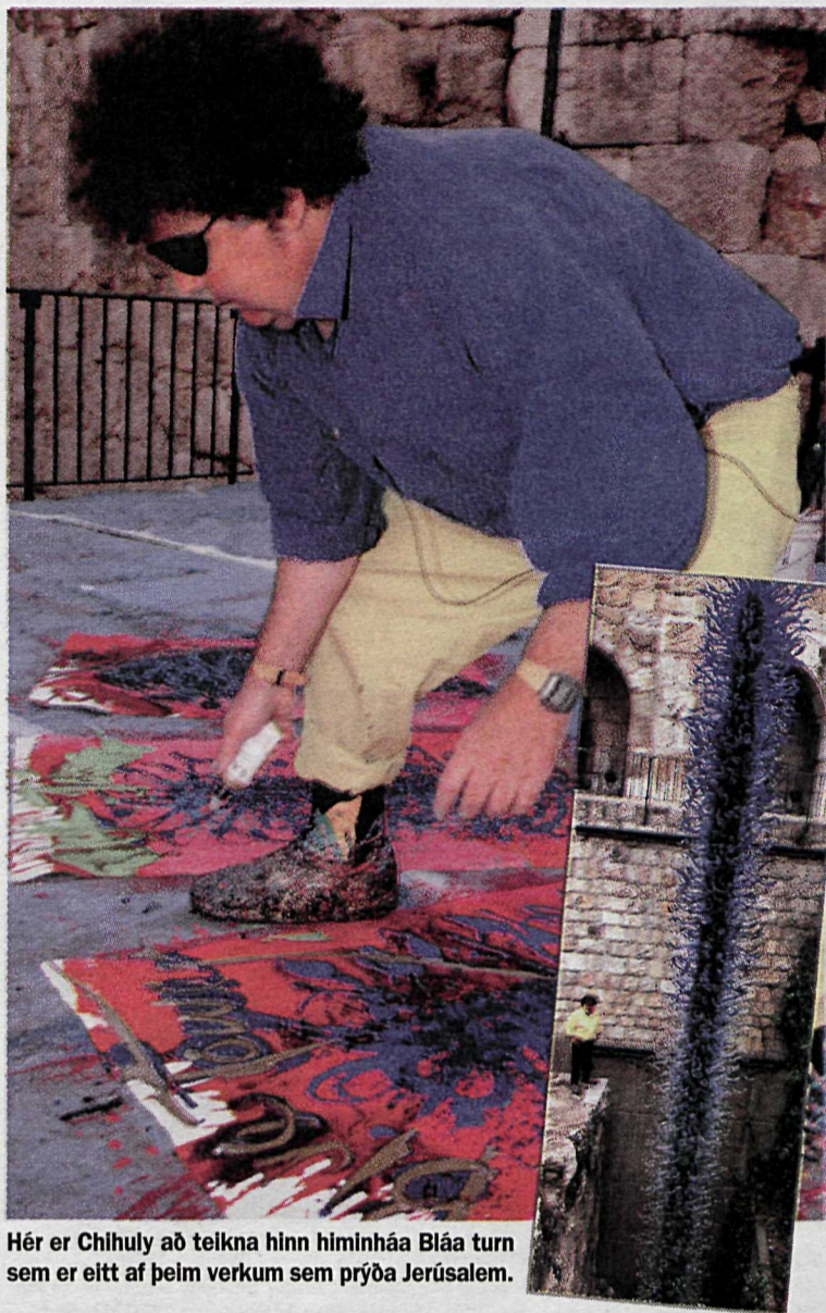
Hér er Chihuly að teikna hinn himinháa Bláa turn sem er eitt af þeim verkum sem þróa Jerúsalem.