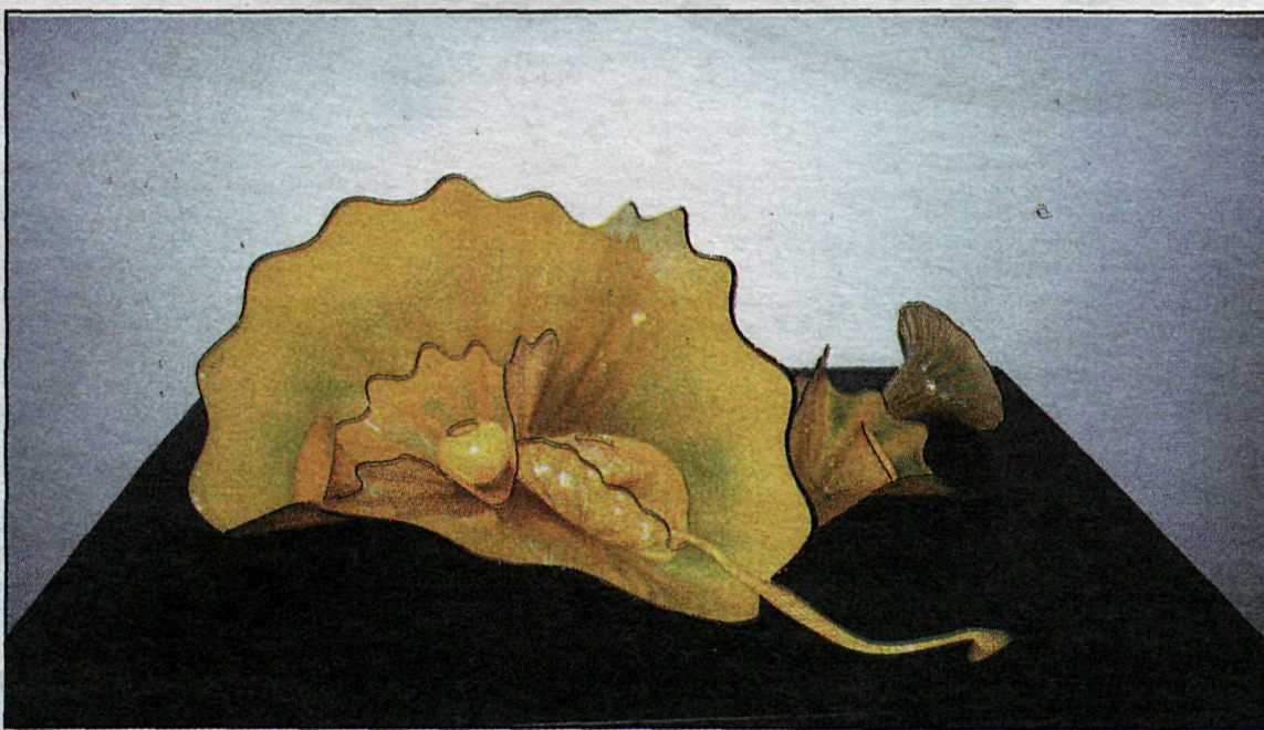
Vöxtur í gulu sem minnir í senn á blóm og grómögn hafsins.

vernda menningarlega landhelgi sína og jafnframt miðla henni til annarra þjóða. Það er þannig vel að merkja fleira landhelgi en fiskilög-saga.