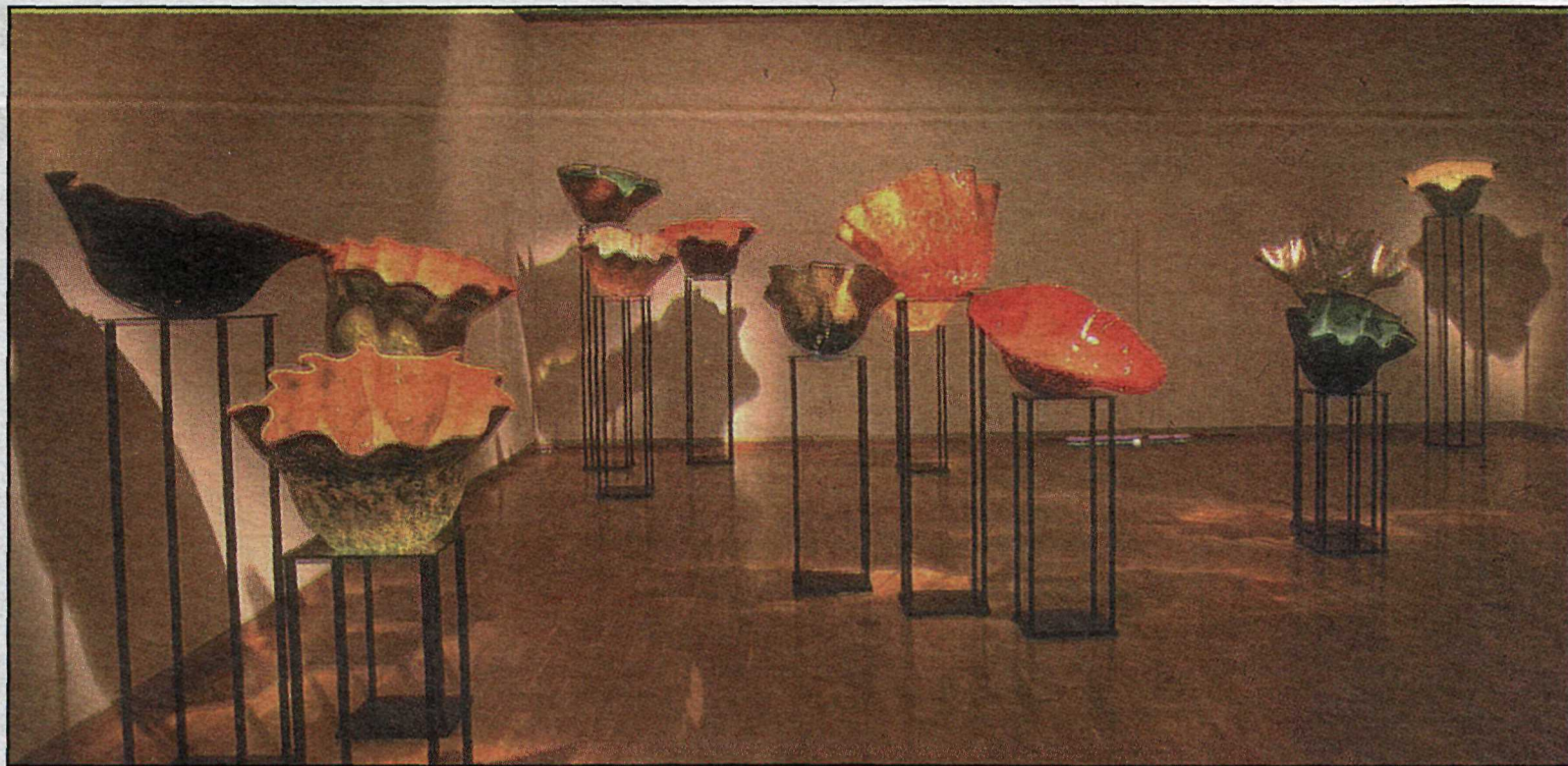
Viðhafnarleg litauðgi er einkenni glerlistar með rætur í Muranó.

Ekki voru viðhöfð nein vettlingatök frekar en í svo mörgu öðru á listavettvangi í Bandaríkjunum, hugsað stórt og höfð mikil umsvif enda skilja menn þar að um grunn-einingar og burðarstöðir sterks þjóðfélags er að ræða, skila sér ekki einungis í sköpunargleðinni og menningarverðmætum heldur einnig beinhörðum peningum. Hér eru Bandaríkjamenn einnig harðastir að